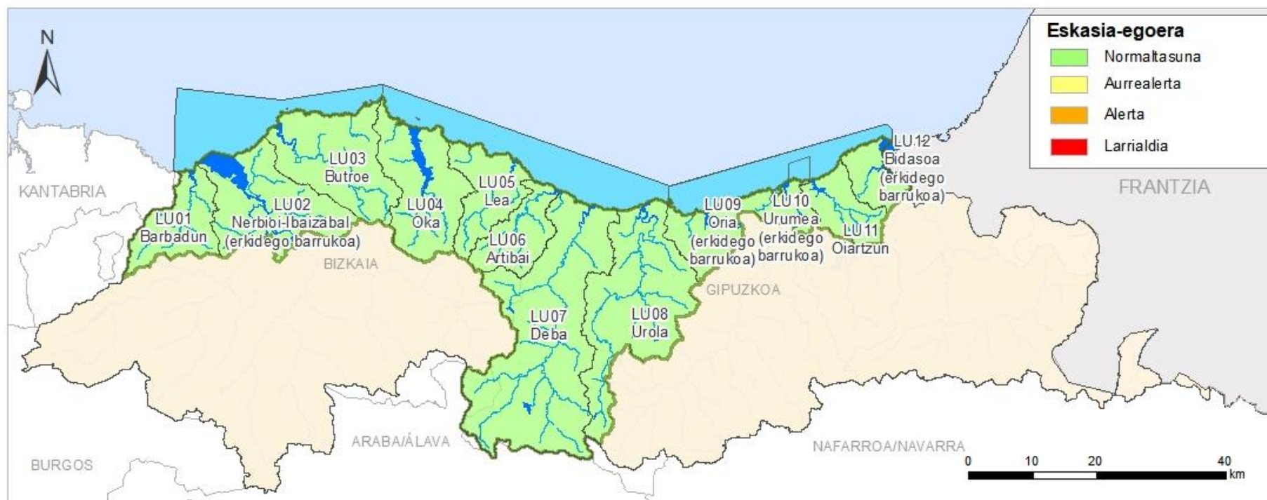
ESKASIA EGOERAREN ADIERAZLEA